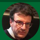
Claudio CASSARDO Università degli Studi di Torino “Emergenza climatica e impatti sulle risorse idriche e sul territorio”