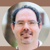
Antonio Parodi Fondazione Cima

Emergenza climatica e impatti sulle risorse idriche e sul territorio