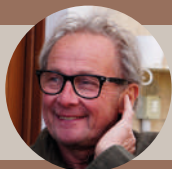
Walter Massa Vigneti Massa

Possibili misure di mitigazione degli effetti negativi del cambiamento climatico in viticoltura